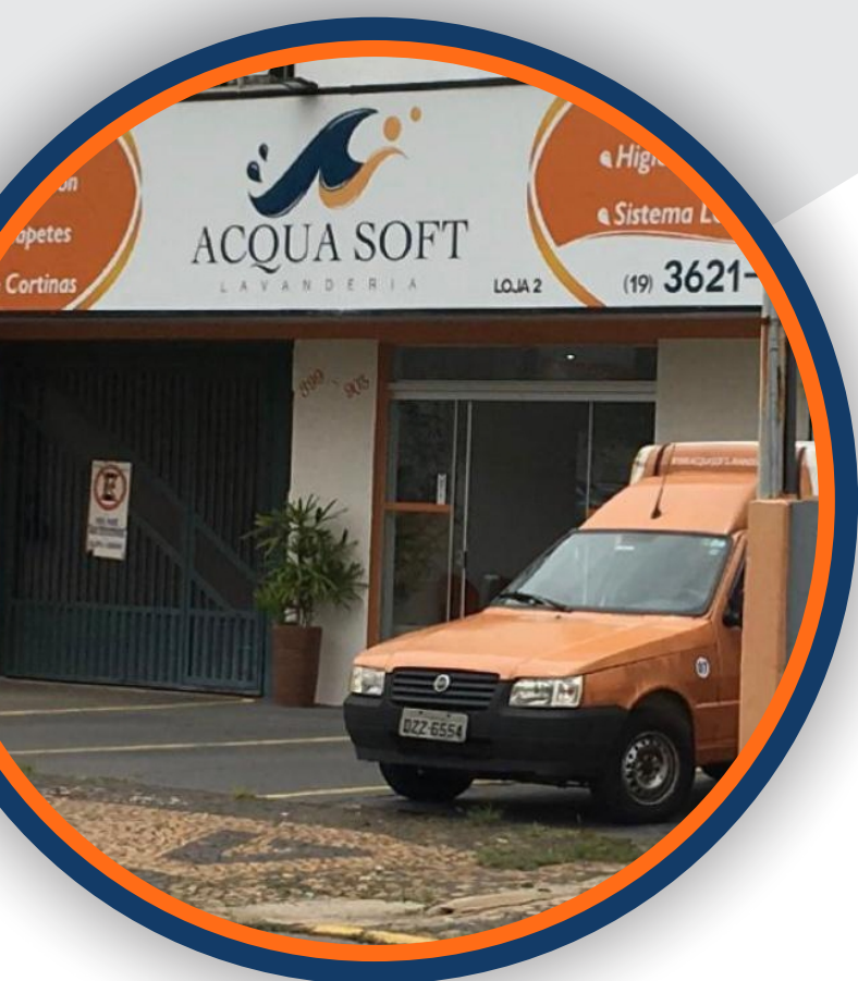
Loja - 02

Isso graças a uma operação de baixo custo e ótima rentabilidade, faz com que todas as lojas sejam lucrativas e tenham payback em um curto espaço de tempo após o investimento inicial.